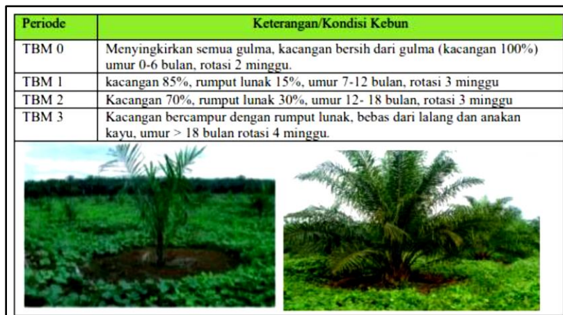
Gambar 1. Kriteria Piringan Tanaman Belum Menghasilkan Kelapa Sawit

pasar pikul dan gawangan harus memperhatikan beberapa ketentuan sebagai berikut.