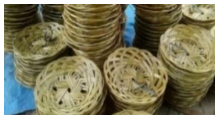
Gambar 6. Produk Kreatif Anyaman Piring

Lidi atau tulang daun kelapa bisa diolah menjadi kerajinan bernilai ekonomis. Daun kelapa sawit terdiri dari rachis (pelepah daun), pinnac (anak daun) dan spines (lidi). Panjang pelepah daun bervariasi tergantung varietas dan tipenya serta kondisi lingkungan. Rata-rata panjang pelepah tanaman dewasa mencapai 9 meter. Jumlah anak daun pada satu pelepah berkisar antara 250-400 anak daun yang terletak di kiri dan kanan pelepah daun dan panjang dibandingkan anak dan letaknya diujung atau di pangkal. Setiap anak daun terdiri dari lidi dan dua helai daun dewasa mencapai 15 meter (Agus, 2015:30 dalam Mashuri dan Hidayah, 2019). Lidi kelapa sawit yang sebelumnya terbuang sia-sia dan belum dimanfaatkan dengan baik oleh pekebun kelapa sawit khususnya di Kecamatan Bahorok Kabupaten Langkat atau sebagian masyarakat yang mencari lidi kelapa sawit menjual kepada para pengumpul lidi (toke lidi) di tingkat pengepul, harga rata-rata lidi adalah Rp 3.000 – Rp 4.500/kg, pemanfaatan lidi kelapa sawit dalam sebuah produk kerajinan memiliki nilai fungsional dan estetika yang bernilai tinggi. Saat ini banyak teknologi pengolahan limbah yang ditujukan untuk mengurangi pencemaran lingkungan salah satunya pemanfaatan limbah kelapa sawit menjadi produk kreatif berbasis lidi seperti anyaman piring.