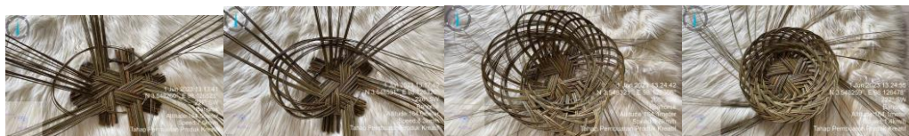
Gambar 3. Tahap Sulaman Atas Produk Kreatif Anyaman Piring