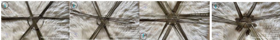
Gambar 2. Tahap Dasar Produk Kreatif Anyaman Piring