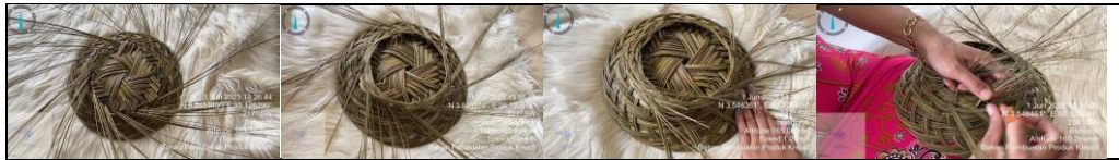
Gambar 4. Sulaman Ekor Tahap Pertama Produk Kreatif Anyaman Piring