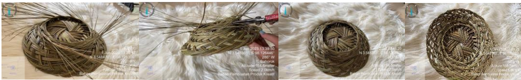
Gambar 5. Sulaman Akhir Produk Kreatif Anyaman Piring