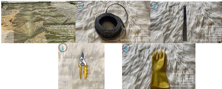
Gambar 1. Alat dan Bahan Pembuatan Produk Kreatif