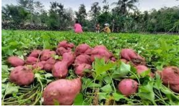
Gambar 1. Tanaman Ubi Jalar Ungu