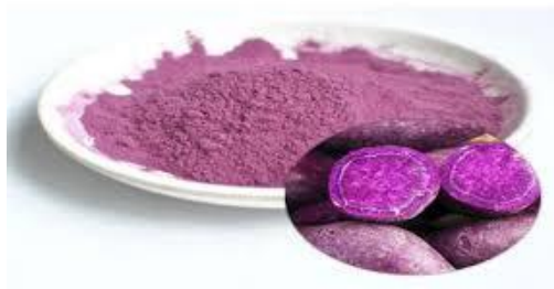
Gambar 2. Tepung Ubi Jalar Ungu

Di dalam ubi jalar ungu segar memiliki tingkat kerusakan tinggi karena kandungan airnya yang signifikan, sehingga di negara yang sedang berkembang umumnya disimpan dalam kondisi kering seperti potongan, fragmen tipis, atau bubuk, pengolahan adalah cara yang efektif untuk menyimpan dan mengawetkan, karena tepung ubi jalar ungu memudahkan penggunaannya sebagai bahan dasar dalam industri pangan dan nonpangan, serta memiliki umur simpan yang lebih panjang, dan diproduksi secara tradisional melalui proses pengeringan sawut, kemudian digiling dan diayak (Montolalu dkk., 2020).