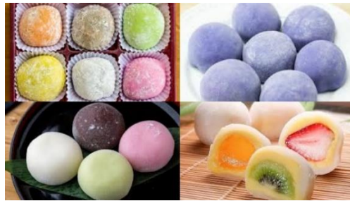
Gambar 3. Mochi

dari bambu dan isian kacang tanah yang tidak terdapat dalam versi aslinya (Nanik Sri Setyani, 2015).