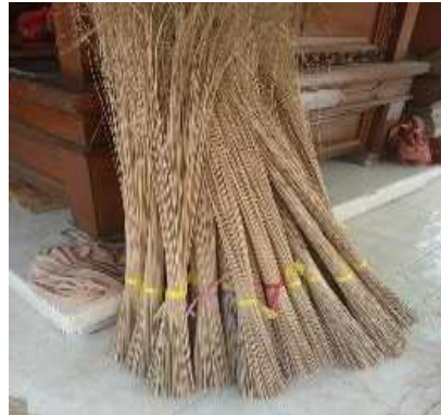
Gambar 1. Sapu Lidi dan Parsel lidi