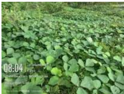
Gambar 1. Mucuna bracteata

Dalam satu rangkaian bunga yang berhasil menjadi polong sebanyak 4 (empat) s.d 15 polong, tergantung dari umur tanaman dan lingkungan setempat termasuk perubahan musim. Polong adalah buah dari tanaman Mucuna bracteata berbentuk memanjang dan pipih. Polong-polong ini diselimuti bulu-bulu halus berwarna merah keemasan yang berubah warna menjadi hitam ketika matang. Biji berwarna coklat tua sampai hitam mengkilap, dari mulai munculnya bunga sampai polong siap dipanen dibutuhkan waktu sekitar 50 s.d 60 hari.