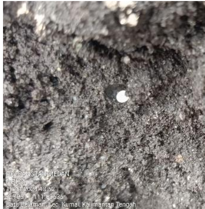
Gambar 1. Telur Kumbang Tanduk