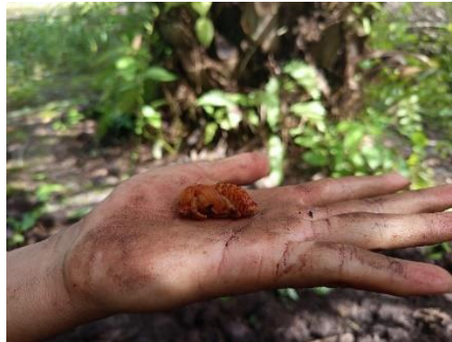
Gambar 3. Pupa Kumbang Tanduk

Ukuran pupa lebih kecil dari larvanya, kerdil, bertanduk dan berwarna merah kecoklatan dengan panjang 5-8 cm yang terbungkus kokon dari tanah yang berwarna kuning. Stadia ini terdiri atas 2 fase: Fase I: selama 1 bulan, merupakan perubahan bentuk dari larva ke pupa. Fase II: Lamanya 3 minggu, merupakan perubahan bentuk dari pupa menjadi imago, dan masih berdiam dalam kokon (Bima dkk., 2023).