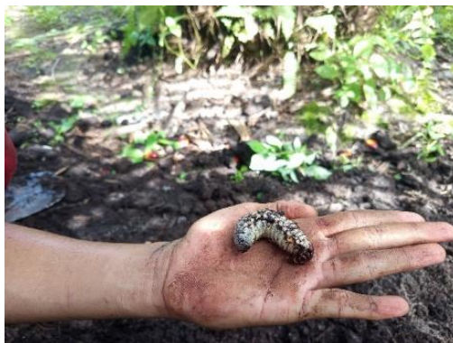
Gambar 2. Larva Hama Kumbang Tanduk

Larva Oryctes rhinoceros berkaki 3 pasang, Tahap larva terdiri dari tiga instar, masa larva instar satu 1-12 hari, instar dua 12-21 hari dan instar tiga 60-165 hari. Larva terakhir mempunyai ukuran 10-12 cm, larva dewasa berbentuk huruf C, kepala dan kakinya berwarna coklat. Larva yang telah dewasa masuk lebih dalam kedalam tanah yang sedikit lembab (lebih kurang 30 cm) untuk berkepompong (Bima dkk., 2023).