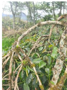
Gambar 2.3 Cabang Kopi Arabika

Kopi arabika memiliki sejumlah cabang yaitu Cabang reproduksi ( ortotrop ) Tumbuh ke arah atas, dari tunas reproduksi di ketiak daun pada batang utama ( primer ). Cabang utama tumbuh dari batang atau cabang yang berfungsi untuk reproduksi. Karena setiap ketiak daun hanya memiliki satu tunas utama, maka jika cabang primer tersebut mati, tidak akan ada cabang utama lain yang muncul di titik tersebut (Wardana, 2023).