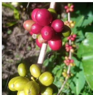
Gambar 2.6 Buah Kopi Arabika

Buah kopi mengalami perubahan warna yang bertahap selama proses pematangan, dimulai dari hijau muda, berubah menjadi hijau tua, kemudian kuning, dan akhirnya mencapai warna merah atau merah hati ketika matang sempurna. Pada tahap matang penuh, daging buah kopi memiliki tekstur berlendir dan mengandung senyawa glukosa yang memberikan rasa manis. Secara struktural, buah kopi terdiri dari dua komponen utama yaitu bagian buah dan biji. Bagian daging buah sendiri tersusun atas tiga lapisan berbeda: eksokarp (kulit luar), mesokarp (lapisan daging), dan endokarp (kulit tanduk) yang tipis namun keras. Secara normal, setiap buah kopi memiliki dua biji, meskipun dalam beberapa kasus dapat ditemukan buah dengan satu biji atau tidak terjadi pembentukan biji (kosong) (Sihombing, 2024).