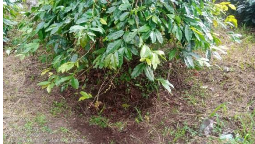
Gambar 2.8 Rorak

lama untuk masuk parit tersebut. Oleh sebab itu rorak yang ada di jalur tanaman akan membantu mengurangi jumlah air yang tergenang. Kondisi ini lebih mendukung di lahan yang memiliki tanah dengan porositas yang rendah dan beriklim sangat lembab serta memiliki surah hujan tinggi (Haryanto, 2019).