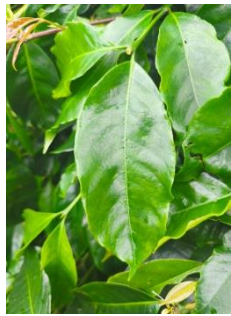
Gambar 2.4 Daun Kopi Arabika

Tanaman kopi memiliki daun dengan ciri morfologi yang khas, berbentuk jorong ( elips memanjang ) dan tersusun secara berselang-seling pada batang, cabang, serta ranting di bagian ketiak daun. Warna daun bervariasi tergantung tingkat kematangannya, dimana daun dewasa berwarna hijau, sementara daun muda dapat berwarna coklat atau hijau pada varietas tertentu. Secara anatomi, komponen daun kopi mencakup petioles sebagai tangkai daun dan lamina sebagai helaian daunnya. Ciri khas daun kopi terlihat pada ujungnya yang meruncing ( acuminate ) dan pangkal daun yang unik, yaitu pinggir daun tidak saling berjump karena terpisah pangkal tangkai daun yang berbentuk tumpul ( obtuse ). Karakteristik morfologis ini menjadi pembeda penting dalam identifikasi tanaman kopi (Sulardi, 2023) .