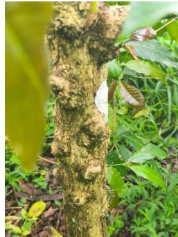
Gambar 2.2 Batang Kopi Arabika

Batang tanaman kopi tumbuh lurus ke atas dengan struktur yang berbuku-buku. Pada varietas Arabika kelompok Typica , tajuknya cenderung tinggi dengan ketinggian mencapai 3,5–4 meter, berbeda dengan kelompok Catimor yang memiliki postur lebih pendek (sekitar 2,5 meter). Sementara itu, tanaman kopi Robusta dapat tumbuh hingga 7–10 meter, dan Liberika bahkan melebihi 10 meter. Namun, pertumbuhan yang terlalu tinggi dapat menyulitkan proses pemanenan buah. Oleh karena itu, diperlukan pemangkasan batang utama hingga ketinggian 1–1,8 meter dari permukaan tanah untuk memudahkan perawatan dan panen (Supriadi, 2018).