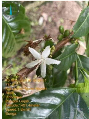
Gambar 2.5 Bunga Kopi Arabika