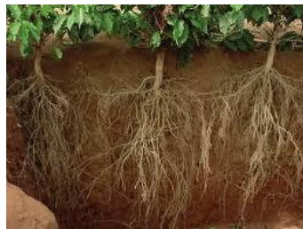
Gambar 2.1 Akar Kopi Arabika

Sistem perakaran tanaman kopi bervariasi tergantung pada faktor lingkungan, termasuk tekstur tanah, struktur tanah, ketersediaan udara ( aerasi ), serta tingkat kesuburan tanah. Selain itu, pertumbuhan akar kopi juga dipengaruhi oleh suhu, kelembaban, usia tanaman, produktivitas, praktik pengelolaan kebun, serta serangan hama dan penyakit. Kopi Arabika, misalnya, cenderung memiliki akar yang tumbuh di zona permukaan tanah pada kisaran 0-30 cm sehingga tergolong lebih dangkal. Meskipun begitu, tanaman kopi memiliki akar tunggang yang berfungsi sebagai penopang utama, membuatnya lebih stabil dan tahan terhadap rebahan. Dari akar tunggang ini, kemudian tumbuh cabang-cabang akar lateral yang menyebar ke samping (Randriani, 2018).