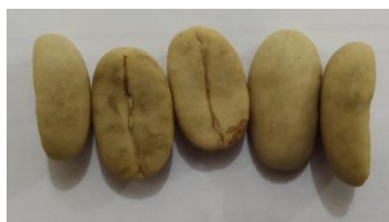
Gambar 2.7 Biji Kopi Arabika

dari dua lapisan utama: (1) testa (kulit luar) yang keras berfungsi sebagai pelindung utama, dan (2) tegmen (kulit dalam) berupa lembaran tipis menyerupai selaput yang biasa disebut kulit ari. Bagian inti biji ( nucleus seminis ) tersusun atas dua komponen penting, yaitu embryo (lembaga) sebagai bakal tanaman baru dan albumen (putih lembaga) yang berperan sebagai penyimpan nutrisi simpanan yang mendukung pertumbuhan kecambah. Secara normal, setiap buah kopi menghasilkan dua biji dengan karakteristik bentuk yang khas - bidang datar (disebut perut) dan bidang cembung (disebut punggung). Namun dalam beberapa kasus, dapat ditemukan biji tunggal ( peaberry ) yang berbentuk bulat panjang akibat perkembangan biji yang tidak sempurna (Hakim, 2021).