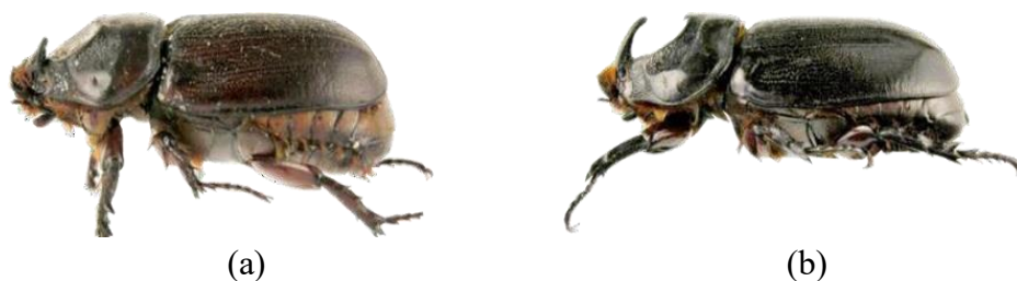
Gambar 1. Jenis Oryctes rhinoceros (a) Betina (b) Jantan (Sunarko 2014)

Imago kumbang tanduk Oryctes rhinoceros Linn umumnya berwarna coklat gelap hingga hitam mengkilap, dengan panjang tubuh berkisar antara 35 hingga 55 mm dan lebar 20 hingga 30 mm. Ciri khas spesies ini adalah adanya satu tanduk mencolok pada bagian anterior tubuhnya. Siklus hidup Oryctes rhinoceros Linn bervariasi, dipengaruhi oleh kondisi habitat dan faktor lingkungan tempat berkembangnya (Ginting, 2020). Pada Oryctes rhinoceros L berfungsi untuk pertahanan diri, pada Oryctes rhinoceros L jantan semakin yaitu untuk menarik perhatian kumbang betina selama musim kawin.