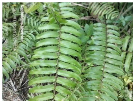
Gambar 1. Pakis Nephrolepis biserrata