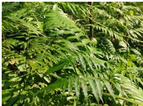
Gambar 2. Pakis Diplazium esculentum

Diplazium esculentum dapat ditemukan di berbagai habitat lembap hingga cenderung basah, seperti tepi sungai, dan daerah berawa. Tumbuhan ini tumbuh dengan baik pada ketinggian hingga 2.300 mdpl dan dapat ditemukan di berbagai