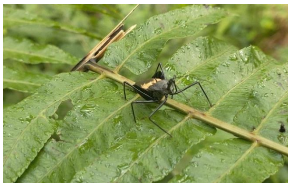
Gambar 3. Sycanus sp.

Sycanus sp. merupakan genus serangga predator yang tergolong dalam keluarga Reduviidae , yang dikenal karena perannya yang signifikan dalam pengendalian hama di sektor pertanian, khususnya di perkebunan kelapa sawit. Dalam konteks pertanian modern, penggunaan pestisida kimia seringkali menjadi solusi utama untuk mengendalikan populasi hama. Namun, pendekatan ini dapat menyebabkan dampak negatif terhadap lingkungan dan kesehatan manusia. Oleh karena itu, pemanfaatan predator alami seperti Sycanus sp. menjadi semakin penting untuk menjaga keseimbangan ekosistem dan mendukung praktik pertanian berkelanjutan (Primanda dkk. 2025).