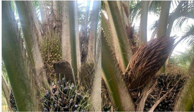
Gambar 4. Bunga Kelapa Sawit