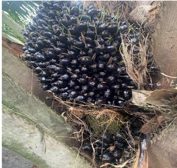
Gambar 9. Buah Partenokarpi Sumber: Dokumentasi Pribadi (2025)

Fruit set suatu tandan ideal adalah 80%, artinya dalam satu tandan tersebut persentase buah yang jadi adalah 80% sedangkan buah yang partenokarpi adalah 20%. Fruit set yang baik pada tanaman kelapa sawit adalah diatas 75%. Semakin tinggi nilai fruit set , maka berat, kualitas dan ukuran tandan akan semakin meningkat, sedangkan ukuran buah semakin kecil. Persentase kernel/tandan, mesokarp buah/tandan ataupun minyak/tandan akan meningkat juga (Susanto, 2012). Produksi fruit set pada tanaman kelapa sawit dipengaruhi oleh beberapa faktor diantaranya ketersediaan air kandungan hara, dan kualitas penyerbukan.