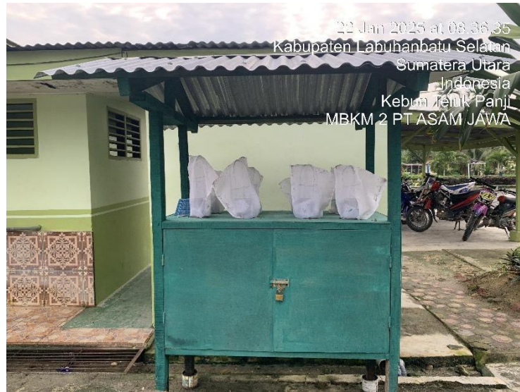
Gambar 6. Kotak Hatch and Carry

Secara umum cara kerja teknologi hatch and carry merupakan kombinasi introduksi dan augmentasi. Introduksi dilakukan dengan memindahkan stadium telur dan larva Elaeidobius kamerunicus yang terdapat pada bunga jantan anthesis. Tandan bunga jantan diangkut ke lokasi baru dan ditempatkan dalam kotak hatch and carry . Secara alami, bunga jantan kelapa sawit adalah tempat Elaeidobius kamerunicus meletakkan telur. Dengan demikian, memindahkan bunga jantan anthesis, secara tidak langsung, akan membawa stadium telur dan larva Elaeidobius kamerunicus yang hidup di dalamnya (Efendi & Rezki, 2020).