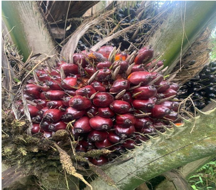
Gambar 5. Buah Kelapa Sawit

Berdasarkan tebal kulitnya, kelapa sawit terklasifikasikan dalam tiga jenis sebagai berikut: