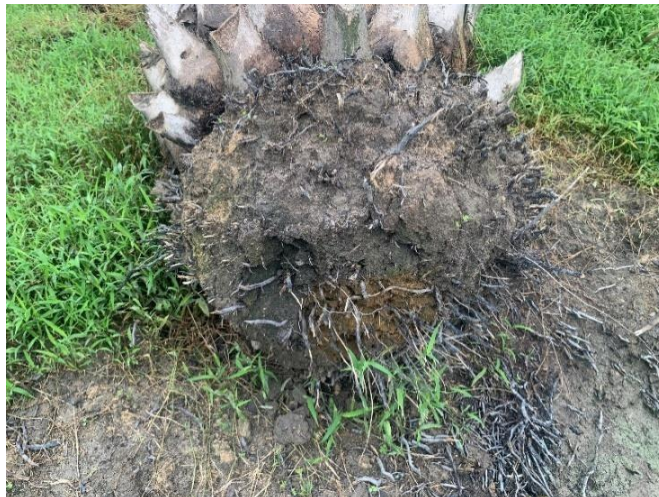
Gambar 1. Akar Kelapa Sawit

Kelapa sawit memiliki akar serabut yang terdiri dari akar primer, tersier, dan kuartier, dengan akar primer tumbuh kebawah. Akar kuartier mempunyai fungsi menyerap unsur hara dan air alami dari dalam tanah. Akar tanaman kelapa sawit tumbuh lebih jauh ke lapisan atas tanah hingga kedalaman 1 m dan berangsur-angsur tumbuh ke bawah. Akar terpadat ditemukan pada kedalaman 25 cm. panjang akar lateral tumbuh bisa mencapai 6 m (Risza, 2020).