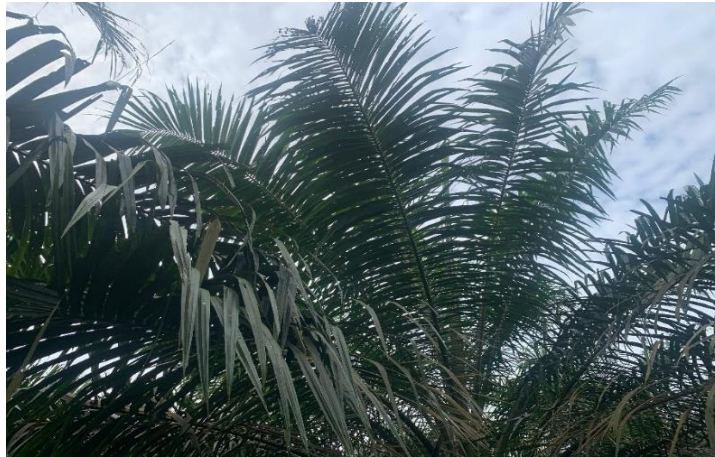
Gambar 3. Pelepah Kelapa Sawit