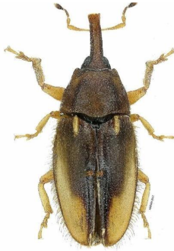
Gambar 7. Serangga Elaeidobius Kamerunicus

bentuk punggung membulat dan berwarna cokelat mengkilat, moncong lebih panjang, rambut pada tubuhnya lebih halus dan pendek dari imago jantan dan tidak terdapat tonjolan pada pangkal elitra (Amallia Rosya, 2023). Sedangkan Imago Elaeidobius kamerunicus jantan berukuran lebih besar (3,35 mm) dari imago betina, moncong lebih pendek, terdapat rambut pada tubuhnya, dan sepasang tonjolan pada bagian pangkal elytra.