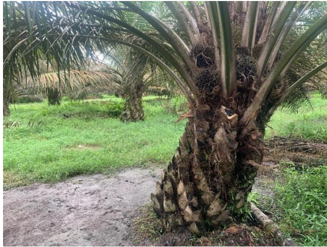
Gambar 2. Batang Kelapa Sawit